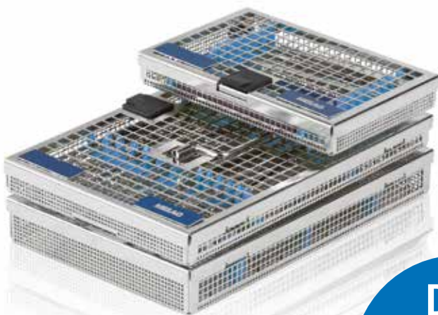
MELAstore – Trays

Durch die sichere Verwahrung der Instrumente im MELAstore-System wird der Schutz für das Praxisteam und für die Instrumente erhöht.