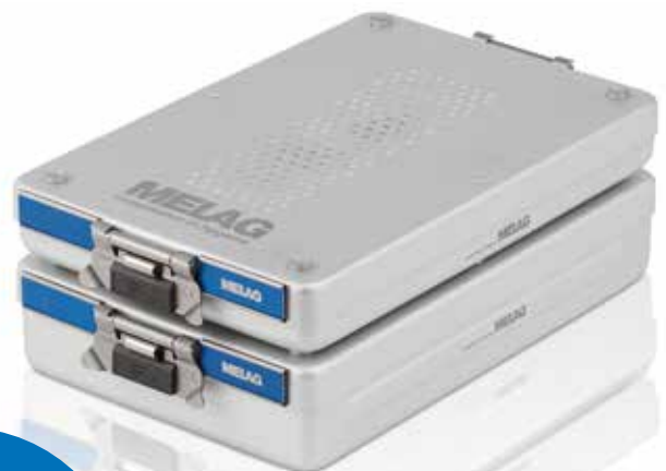
MELAstore – Boxen